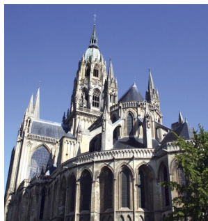
Cathédrale de Bayeux

A découvrir : la Tapisserie, la cathédrale, les musées, Liberty Alley.