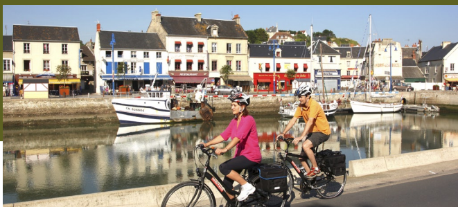
Port de pêche de Port-en-Bessin

Dans cette cité médiévale pleine de charme votre découverte vous mènera à deux joyaux : la cathédrale et la Tapisserie de Bayeux inscrite au registre Mémoire du Monde de l'UNESCO.