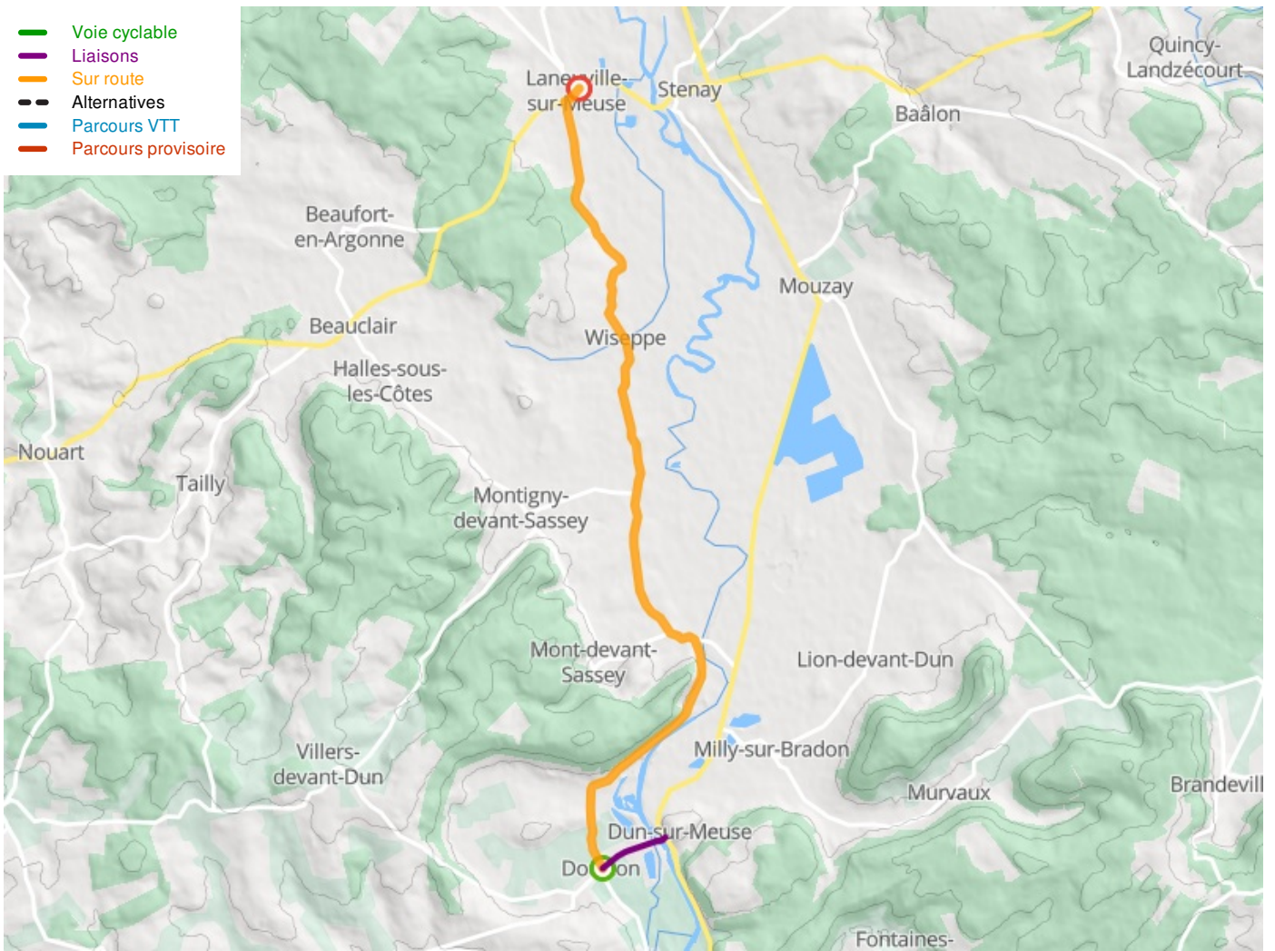
Départ Dun sur Meuse